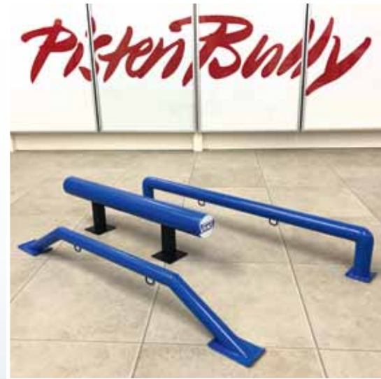
Fertige Obstacles: vorne ein Industry Trannyfinder, in der Mitte ein Hovertube und hinten eine Industry Flatrail

Rohr verklebt. Die Bodenplatten bestehen aus 1-Millimeter-Alublech mit aufgebogenen Enden. Beim Flatrail habe ich an den Bodenplatten für eine stabile Verklebung Kunststoffzylinder angebracht und zusätzlich mit einer Senkkopfschraube gesichert. Mit dem Zweikomponenten-Epoxykleber kann man übrigens auch sehr schön die Schweißnähte des Originals nachempfinden.