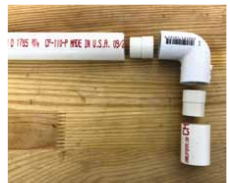
Verbinden von Rohrstücken