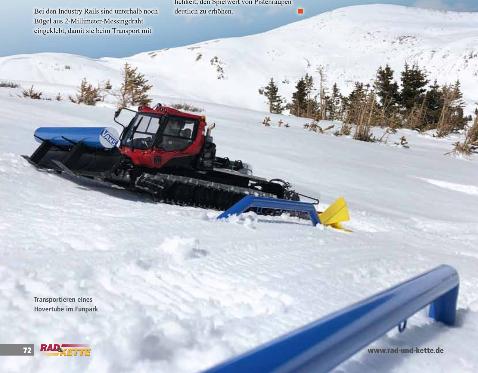
Transportieren eines Hovertube im Funpark

der Gabel nicht seitlich verrutschen können. Zum Schluss habe ich die Hindernisse sorgfältig verschliffen und dabei alle aufgedruckten Markierungen entfernt, die sonst durch den Lack durchscheinen können, und mit einer Spraydose aus dem Baumarkt lackiert. Damit ausgestattet konnte ich einen kleinen Funpark in den Bergen aufbauen, mit meinem PistenBully 400 ParkPro 4F präparieren und die Obstacles transportieren. Eine ganz neue, wirklich tolle Möglichkeit, den Spielwert von Pistenraupen deutlich zu erhöhen. ■