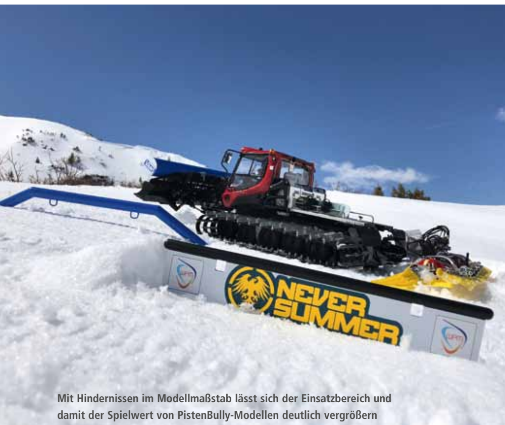
Mit Hindernissen im Modellmaßstab lässt sich der Einsatzbereich und damit der Spielwert von PistenBully-Modellen deutlich vergrößern