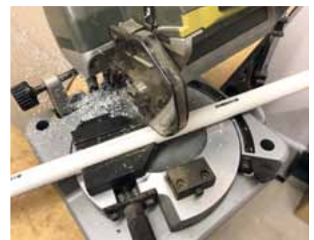
Winkelgenaues Trennen der Rohre mit der Kappsäge