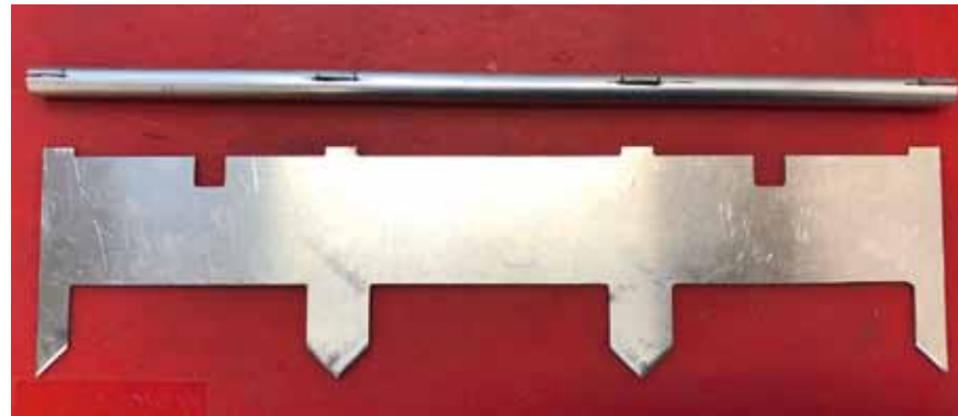
Gestell aus Alu-Blech für eine Straight Rail

in einem Sturz endet und zu Verletzungen führen kann. Ehrensache also, dass auch im Modell keine Stufen vorhanden sein dürfen und deshalb ist etwas Schleifarbeit unumgänglich. Die groben Arbeiten habe ich mit Körnung 150 erledigt, um dann mit 360 und 600 die Oberfläche für das Lackieren glatt zu schleifen.