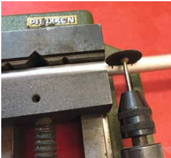
Befestigungsnuten wurden mit der Trennscheibe erstellt