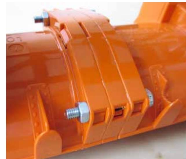
Verschraubung der beiden Gehäuse

Die Schneesleuder kann somit als Einzelsleuder an Bruder Traktor- und Unimog-Umbauten eingesetzt werden. Nachdem ich aber kein solches Modell besitze, war wiederum eine Doppelvariante für meinen PistenBully 600 angesagt. Diesmal ging ich aber einen Schritt weiter in Richtung großes Vorbild und führte das Mittelteil der Trommel einteilig aus. Dazu musste eine dritte Bruder-Sleuder als Teilespender erhalten, weil ich zwei zusätzliche Schneckenwendel benötigte und ein Endstück zum Auffüllen des Spaltes. Die Gesamtbreite erhöht sich nämlich um 7 Millimeter. Die beiden Schleudergehäuse habe ich nach der Montage am Rahmen in der Mitte verklebt und zusätzlich verschraubt. Das ergibt eine sehr verwindungssteife Konstruktion, was insbesondere für den ruhigen Lauf des langen Mittelteils wichtig ist. Die ursprünglichen Halterungen habe ich entfernt, passend zur Rundung des Gehäuses abgeschliffen und mit reichlich Zweikomponenten-Epoxykleber fixiert. Über die zuerst gebaute Version 1 freut sich übrigens mein Neffe Fabian als Anbaugerät für seinen PistenBully.