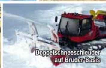
Doppelschneeschleuder auf Bruder-Basis