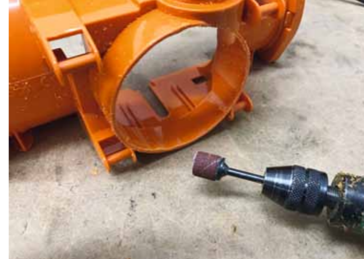
Aushöhlen der Bruder-Schleuder mit Säge- und Schleifwerkzeugen

Aber die Ernüchterung kam bald, als ich die Teile vor mir hatte. Konkret heißt das: Ein