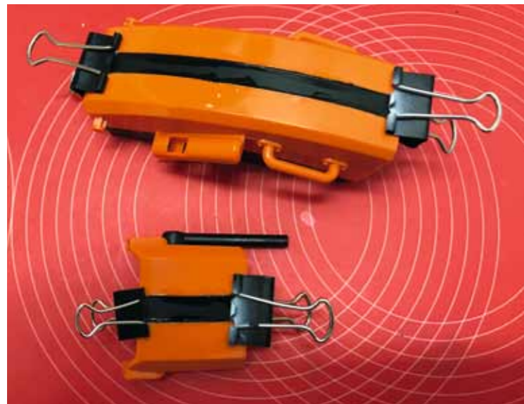
Die ersten Kamine wurden aufwändig mit Polystyrolstreifen breiter gemacht

passen, habe ich Distanzringe auf der Drehbank hergestellt. Ebenso wurde die Bohrung des großen Kegelrads auf der Drehbank mit einem Innendrehstahl auf 6 Millimeter erweitert. Nur so wird die Bohrung wirklich zentrisch, selbst auf der Drehbank werden Bohrungen manchmal nicht gerade und ich spreche da aus Erfahrung... Zur Abstützung des Kegelrades klebte ich ein 14 x 6 Millimeter großes Kugellager in das Gehäuse und passte dann eine Distanzhülse so an, dass das Spiel zwischen den Zahnradern stimmt.