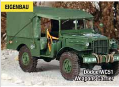
Dodge WC51 Weapons Carrier