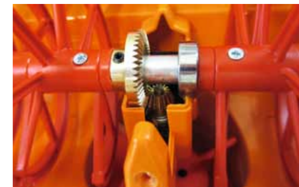
Version 1 mit Kegelradgetriebe

kreisrundes Wurfradgehäuse im passenden Durchmesser aus Blech zu fertigen, war für mich ein Ding der Unmöglichkeit. Eines Nachts kam mir aber der Gedanke, warum nicht 3D-Druck einsetzen? Im „virtuellen Modellbau“, also dem Konstruieren im CAD, kenne ich mich schließlich aus. Dazu musste zuerst einmal Maß genommen werden und dafür musste ich das Brudergehäuse zerlegen und aushöhlen. Die einzelnen Teile sind zusammengetackert und können durch Anpressen mit Hilfe eines Schraubenziehers an den entsprechenden Stellen gelöst werden. Dann kam meine Micromot, ein Bohr- und Fräsgewerkzeug der Firma Proxxon zum Einsatz, zuerst mit dem dünnen Sägeblatt, dann