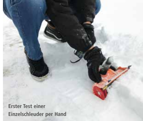
Erster Test einer Einzelschleuder per Hand

Natürlich sollte der Kamin ferngesteuert gedreht werden können. Dafür verwende ich einen kleinen Getriebemotor, für den das passende Gehäuse gleich in der richtigen Position am Motorhalter mitgedrückt wird. Der Kamin der Bruder-Schleuder ist wie eingangs erwähnt unten geschlossen und am Gehäuse befestigt. Sobald man ihn unten öffnet, fällt diese Befestigungsmöglichkeit weg. Für die Drehbewegung nahm ich ein Dünning-Kugellager mit 25 Millimeter Innendurchmesser. Auf dieses wird am Außenring ein Druckteil geklebt, das als Basis für den Kamin dient. Praktischerweise wird der Zahnkranz für die Verstellbewegung gleich mitgedrückt. Da ich kein passendes Ritzel finden konnte, ließ ich dieses auch drucken. Und damit der Verstellantrieb