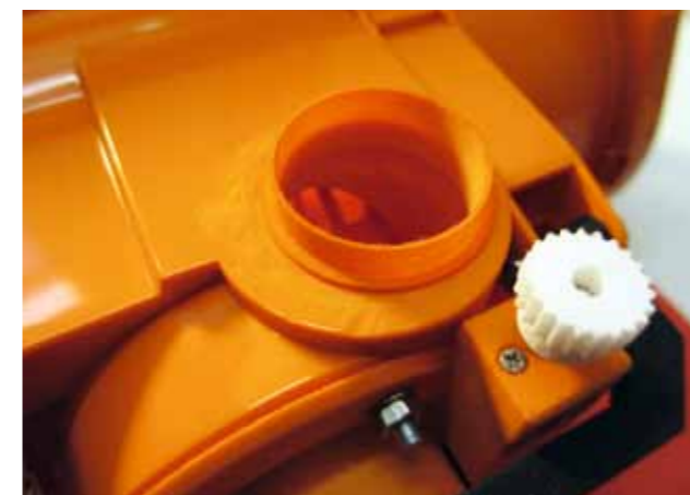
Befestigungshülse für das Kaminkugellager

Mittlerweile hatten wir Ende April, und ich war wohl der Einzige hier, der sich über einen unerwarteten Schneefall über Nacht freute. Gerade am Vortag hatte ich die Schleuder fertig zusammengebaut, und der erste Test wurde noch vor dem Frühstück durchgeführt, so lange der Schnee noch frisch und pulvrig war. Mit heulendem Motor schob ich die Fräse per Hand durch den Schnee, es war eine wahre Freude, wie sie diesen meterweit wegschleuderte. Erfreulicherweise gab es keinerlei Schneeanlagerungen an den rauen Druckteilen. An dieser Stelle sei darauf hingewiesen, dass sich Schnee leider nicht im Maßstab mitverkleinert, er bleibt immer 1:1. Daher eignet sich nur trockener, feinkristalliner Schnee wirklich gut für eine Modellschneeschleuder in diesem Maßstab. Bei feuchtem Pappschnee kapitulieren nicht nur diese, sondern auch weit größere Schneefräsen.