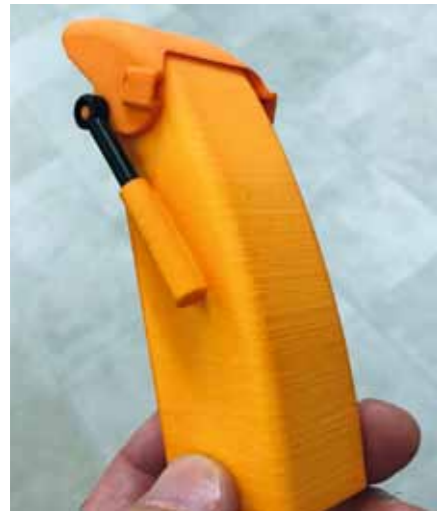
Verbreiteter Kamin als Druckteil mit händischer Wurfweitereinstellung

der Doppelschneesleuder am PistenBully genutzt. Wie war das noch gleich mit den höherschlagenden Herzen der Jungs?