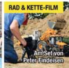
Am Set von Peter Findeisen