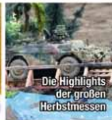
Die Highlights der großen Herbstmessen