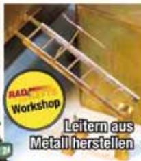
Leitern aus Metall herstellen