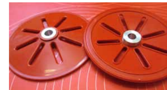
Endscheiben mit gedrehten Naben aus Aluminium

Nachdem ich mit Messschieber und Lineal die benötigten Abmessungen ermittelt hatte, konstruierte ich im CAD den hinteren Teil des Wurfradgehäuses mit dem Auswurfstutzen. Das war so natürlich wesentlich einfacher für mich als Blechteile passend zusammenzulöten. Das Wurfrad konstruierte ich in Anlehnung an Fotos einer Westa-Schleuder mit fünf Schaufeln, die vorne wie beim Original gekrümmt sind. Als Motor hatte ich aufgrund der Ratschläge einen relativ lang-