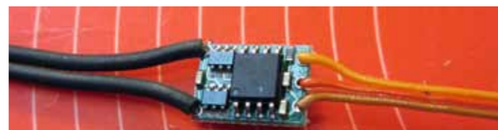
Miniaturfahrregler für die Kaminverstellung

vor Schnee geschützt ist, konstruierte ich noch eine passende Abdeckung.