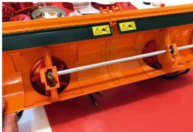
Durchgehendes Gehäuse von vorne

Alle Druckteile können im Webshop von AT modellbau auf www.shapeways.com/shops/at-modellbau bestellt werden. Eine Liste der benötigten Zahnräder, Motoren und anderen Teile ist auf der Website von Walser Pistenraupenmodellbau www.pistenraupen.com zu finden.