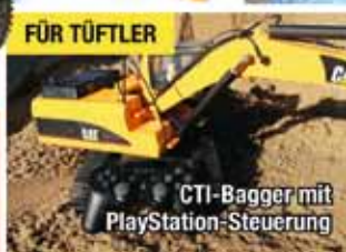
CTI-Bagger mit PlayStation-Steuerung