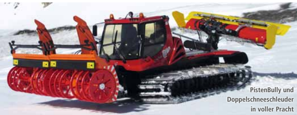
PistenBully und Doppelschneesleuder in voller Pracht